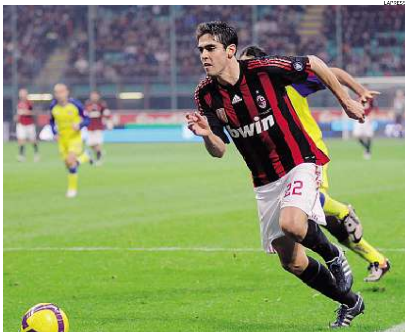
► Per Kakà 4° gol in campionato: 2 su azione (Lazio e Atalanta), 2 su rigore (Siena e Chievo)