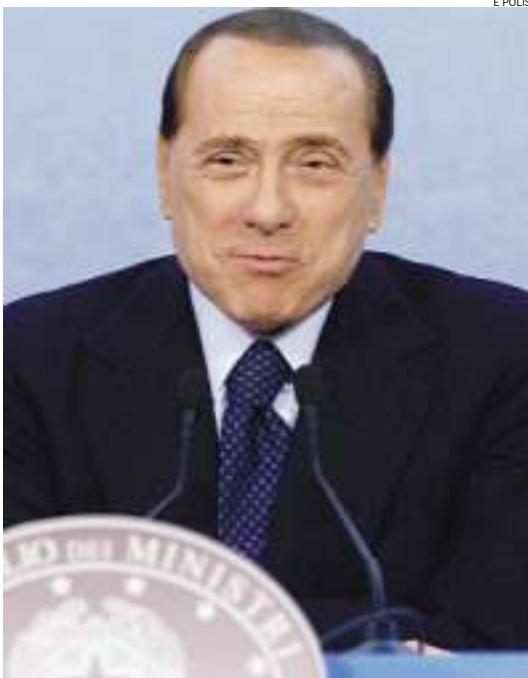
► Silvio Berlusconi

«STO BENISSIMO - ha detto Berlusconi - stamattina dovevo andare prima a Montecatini (alla riunione dei Circoli di Marcello dell'Utri, ndr) e poi venire da voi, non ce l'ho fatta. C'è stato un ritardo di due ore nel programma e avrei creato scontentezze scegliendo l'uno o l'altro. Ho visto che sono venute fuori notizie di un mio malore: non ho avuto assolutamente nessun malore, vi assicuro che sto benissimo. Sono in piena forma, pronto ad affrontare tutto con la gagliardia di un ventenne». Nel corso del collegamento, il premier non ha perso l'occasione per attaccare la sinistra «divisa e inconcludente». «Siamo delusi da una sinistra che ha avuto responsabilità di