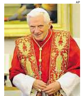
► Benedetto XVI

Nel corso dell'Angelus in Piazza San Pietro il papa ha rivolto un appello a «guidatori, passeggeri e pedoni» esortandoli a «stare sobri e attenti» e ad avere sempre coscienza delle loro responsabilità nei confronti degli altri. Il pontefice si è basato sulle parole di san Paolo, utilizzate nella liturgia della Parola domenicale.