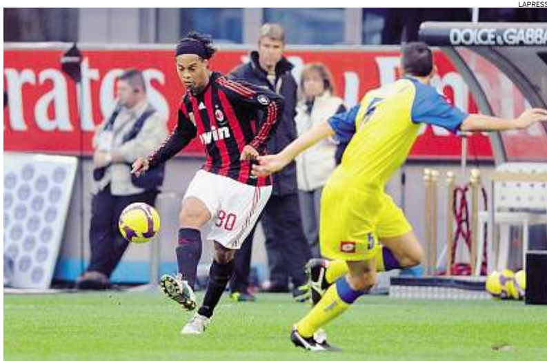
► Buona la prestazione di Ronaldinho esaltato anche da Ancelotti

ARCHIVIATO IL "CASO" di giornata non resta che guardare alla classifica che, dopo le sconfitte di Napoli e Udinese «si delinea più chiaramente secondo le previsioni», considera Ancelotti ben contento di «stare lì, attaccato all'Inter». Ma se, come fa notare Galliani «dal giorno del raduno tutto