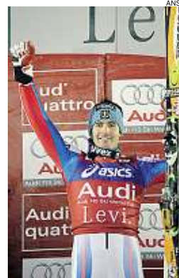
► Jean-Baptiste Grange

torna sul podio dopo quasi quattro anni dalla vittoria al Sestriere, mentre Mario Matt completa il terzetto dei migliori. Nell'ordine d'arrivo non figura purtroppo nessun italiano. Se il gigante oltobrino di Soelden aveva a destato qualche preoccupazione, la prestazione finlandese boccia clamorosamente i nostri specialisti. Manfred Moelgg, partito col pettorale di leader grazie al successo nella coppa di slalom la scorsa stagione, ha superato a fatica il taglio al mattino in ventiseiesima posizione e nella seconda manche è finito fuori senza quasi lottare. Il finanziere di San Vigilio di Marebbe fatica a trovare il feeling con i