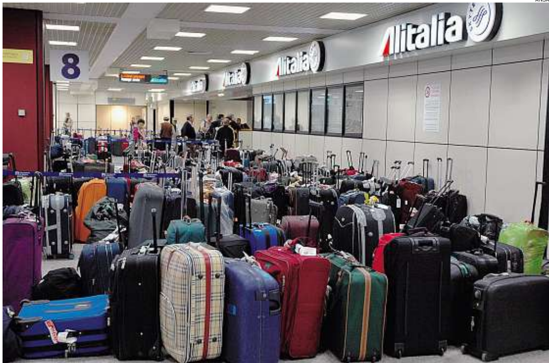
► I bagagli in attesa di essere riconsegnati ai proprietari nell'aeroporto di Fiumicino