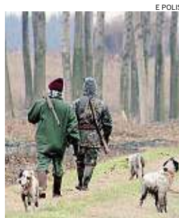
► Incidente di caccia

Un cacciatore è morto a Castelnuovo Garfagnana colpito da uno sparo di un compagno di battuta di caccia al cinghiale. La vittima, raggiunta alla testa da un proiettile, aveva 35 anni. Si tratterebbe di un incidente, dovuto a un errore compiuto da un compagno di caccia. I militari hanno ascoltato i componenti del gruppo per ricostruire la dinamica della vicenda.