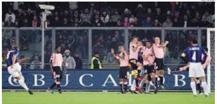
► La punizione del 2-0 con cui Ibrahimovic ha chiuso la pratica Palermo

SAMUEL , confermandosi anche a Palermo ai livelli della passata stagione, dopo l'ottimo esordio di settimana scorsa con l'Udinese ad 11 mesi dall'infortunio al ginocchio sinistro, e restituendo all'Inter speciale quella compattezza nel settore arretrato (0 reti subite con l'argentino in campo nelle ultime 2 partite) che a Reggio Ca-