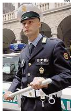
► Preso dopo l'inseguimento

conducente, ed è stata fermata poco più avanti. A quel punto l'uomo è sceso dalla vettura impugnando una barra metallica lunga cinquanta centimetri e ha cercato di colpire gli agenti. Dopo una breve colluttazione la pattuglia è riuscita a immobilizzarlo. Il fermato, un marocchino di 22 anni, clandestino e con precedenti per furto e spaccio. Gli agenti lo hanno sottoposto al test alcolometrico e il risultato non ha lasciato spazio a dubbi: l'uomo aveva nel sangue una quantità di alcol pari a 1,50 grammi per litro. Era insomma completamente ubriaco. L'uomo, tratto in arresto, è risultato