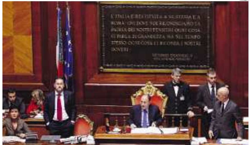
► La prossima settimana la discussione in Senato

mento della discordia potrebbe approdare in Aula già la prossima settimana. Tra i principi generali: il miglioramento della contrattazione collettiva, l'introduzione di sistemi di valutazione volti a garantire standard internazionali di qualità, la valorizzazione del merito, la definizione di un sistema rigoroso di responsabilità dei dipendenti pubblici, il rafforzamento del principio di concorsualità per l'accesso al pubblico impiego e per i salti di carriera, il miglioramento del sistema di formazione dei dipendenti pubblici. Una rivoluzione, secondo il ministro della Funzione pubblica,