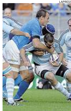
► Parisse non è bastato

Mallett non ha accampato scuse. Prima della partita aveva detto che la sua nazionale aveva il 50% di possibilità di battere l'Argentina, ma gli azzurri sono mancati in attacco, Marcato ha sbagliato troppo sui calci piazzati