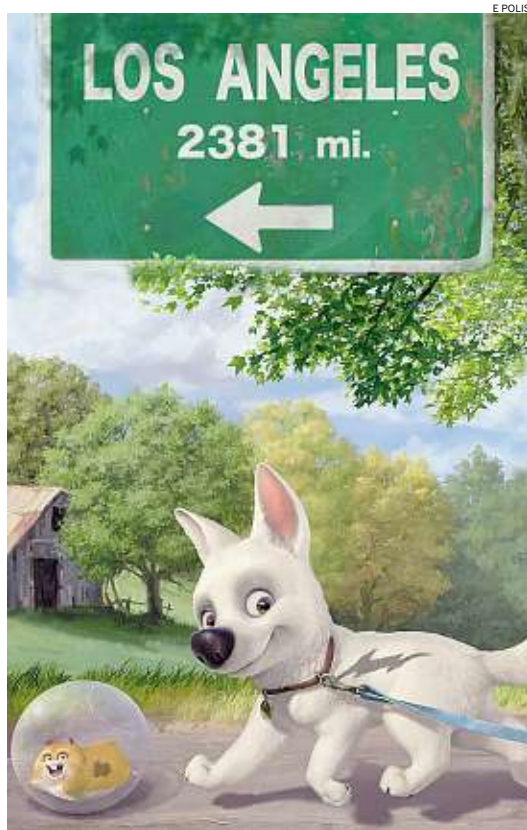
► Bolt, l'eroe a quattro zampe della Disney

Due eventi che proiettano e confermano, Torino come ombelico del mondo: cinema e audiovisivo. Tre giorni dove si incontrano domanda e offerta del settore dell'audiovisivo, e questo a pochi giorni da altri due appuntamenti cinematografici di livello internazionale: il Torino Film Fest e SottoDiciotto Film Festival . E, il sipario del