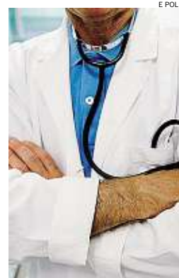
► Otto mesi di malattia

il processo immediato. Il suo difensore, l'avvocato Giuseppe Lucibello, aveva avanzato un'istanza di patteggiamento. Su di lei aveva puntato i riflettori "Striscia la Notizia" che aveva fatto scattare l'inchiesta. Il medico era risultato in malattia per otto mesi senza avere una sola delle patologie che si certificava falsificando in alcuni casi le firme di colleghi medici. Fratture di vertebre inesistenti, ricoveri e visite mai avvenuti. A maggio l'arresto con la consegna da parte dei finanziari di un'ordinanza di custodia cautelare per aver falsificato i certificati e aver intascato