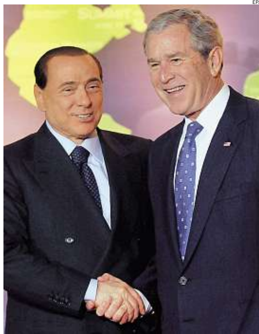
► Silvio Berlusconi e George W. Bush al G20

UN ELENCO INIZIALE di misure specifiche, tra cui l'impegno per stimolare e mantenere aperta l'economia globale, è delineato nel «piano di azione» in cinque punti che fissa le priorità da portare a termine entro il 31 marzo 2009. L'esito del G20, contestato dai no-global, ha però sollevato perplessità da parte di osservatori e analisti: alcuni hanno fatto notare che il piano non contempla la creazione di un unico «supervisore sovranazionale» dei mercati finanziari, mentre altri hanno sottolineato come «nonostante le buone intenzioni, i progressi saranno ar-