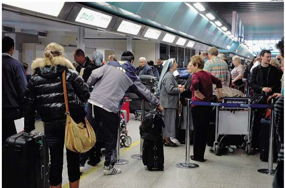
► Passeggeri in coda davanti ai check-in di Alitalia a Linate

CANCELLATI una ventina di voli, mentre molti altri hanno subito ritardi tra i dieci minuti e le due ore abbondanti. A Linate le cancellazioni hanno coinvolto nove voli in partenza e undici in arrivo: sia per destinazioni nazionali sia estere, voli da e per Roma Fiumicino, Napoli, Francoforte, Madrid, Amsterdam. Un volo per Reggio Calabria delle 10,20 è riuscito a decollare solo alle 12,30, mentre un aereo per Roma Fiumicino delle 11, con prevista partenza per le 12,25 è poi stato cancellato. A Malpensa sono stati cancellati voli per Istanbul, Sofia, Parigi. Un aereo diretto a Tokyo previsto in partenza per le 14,35 è stato spostato alle 18,35. Rassegnati e tranquilli i passeggeri che lamentano più che altro la scarsa informazione. Come accade da quasi una settimana, infatti, le cancellazioni vengono annunciate, nella maggior parte