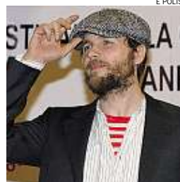
► Lorenzo Jovanotti