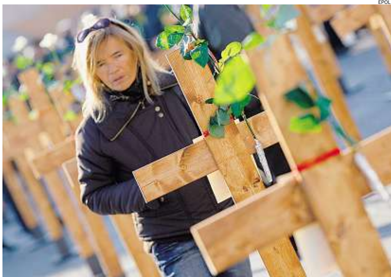
► La manifestazione a Brescia dello scorso anno: croci in piazza per ricordare i morti su strada