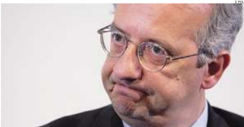
► Il segretario del Pd Walter Veltroni