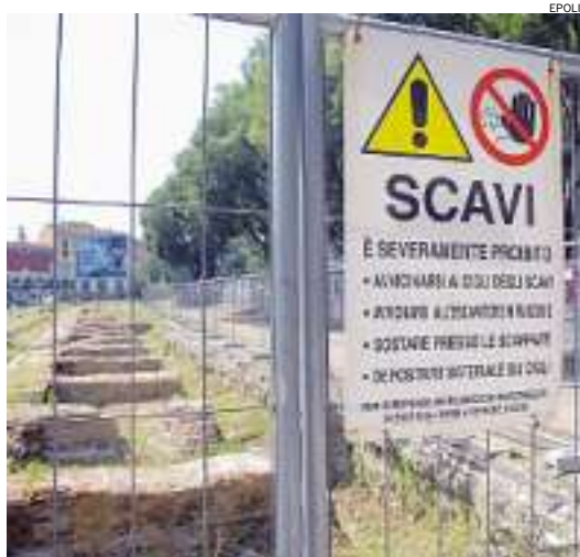
► Il cantiere della Darsena

CON QUEL documento il partito ha chiesto al ministro della Cultura Sandro Bondi di revocare la realizzazione dei parcheggi interrati di Sant'Ambrogio e della Darsena. Come? Utilizzando gli stessi criteri applicati a Roma per fermare lo scavo e annullare il progetto del parcheggio sotto la collina del Pincio. Sull'ordine del giorno radicale, Landonio e Rizzo raccoglieranno le firme di altri colleghi e chiederanno che sia