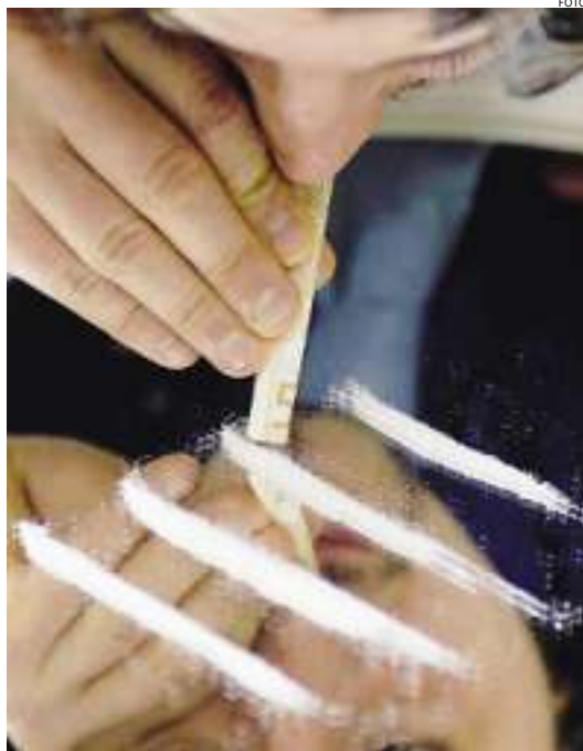
► Milano resta ancora la capitale della cocaina

La droga sbarca in Rete e conquista i social network. Il sito di incontri più famoso del mondo, Facebook, ospita una community di fan della cocaina. Un'apologia del genere non poteva che partire da Milano, la città italiana dove si fa più uso della polvere bianca. In gergo a Milano i giovani la cocaina la chiamano "barella". Proprio come il gruppo nato su Facebook, che già conta 85 "amici della barella". Un vero e proprio fan club con tanto di foto shock e video sul tema. La pagina web si apre con la frase "Che mondo sarebbe senza barella". Tra i post una foto di una ragazza che sniffa cocaina. Non mancano i messaggi che ragazzi e ragazze hanno lasciato sulla bacheca. Tra questi c'è chi scrive, commentando una foto: «con quel naso lì sempre sul cd non mol-