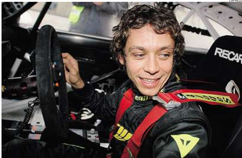
► Vale Rossi, in coppia con Carlo Cassina, dopo 8 prove speciali, si è piazzato dietro Dindo Capello

La Ford Focus conquista la 30esima edizione del Monza Rally Show ma a differenza delle due passate edizioni non è Valentino Rossi a salire sul gradino più alto del podio nella kermesse disputata all'interno dell'autodromo brianzolo. Il campione del mondo della MotoGP, in coppia con Carlo Cassina, si è piazzato al secondo posto al termine delle otto prove speciali, battuto dal compagno di squadra Dindo Capello. A Valentino non sono bastati i due successi nelle due tappe conclusive per ribaltare una situazione compromessa nella giornata di sabato, quando due errori (sotto forma di spegnimento di motore) gli avevano fatto perdere quasi 30" e allontanato dalla vetta. La zampata del campione nella giornata di chiusura ha consentito alla sua Ford del team RamSport di risalire due posizioni nella classifica generale e piazzarsi alle spalle di Capello con un ritardo di 20"3 (1h11'11" contro 1h11'31"). Al bravo Dindo sono bastati un secondo e un terzo posto per tenere a distanza gli avversari, mentre Omar Longhi e Luca Cassol su Subaru Impreza hanno concluso al terzo posto nella classifica generale, staccati di 23"9. «L'obiettivo era quello di finire al secondo posto, onestamente non si poteva fare di più