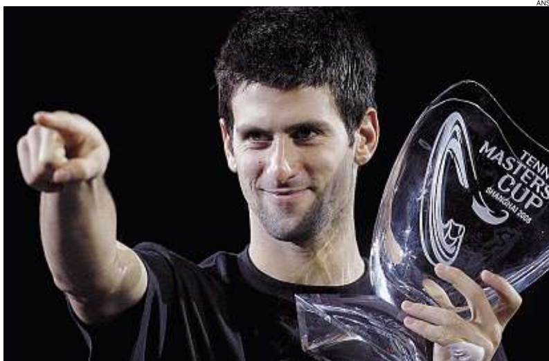
► Djokovic, primo serbo a vincere i Masters, ha chiuso la stagione n° 3 Atp dietro Federer e Nadal

È NOVAK DJOKOVIC il maestro dell'ultimo scorcio del 2008, il serbo ha rubato la scena ai malconci Rafael Nadal e Roger Federer, dominatori della scena mondiale da quattro anni che ora vedono avvicinarsi a grandi passi il ventunenne di Belgrado. Se lo spagnolo è tenuto ai box da un'inflammazione al tendine rotuleo del ginocchio che ne ha chiuso anticipatamente l'annata e lo svizzero è perseguitato da un'infinità di piccoli guai che anche in Cina ne hanno condizionato il rendimento, tanto da fargli mancare le semifinali per la prima volta negli ultimi sette anni, Nole ha dimostrato la sua completa maturazione con un netto successo in finale su Nikolay Davydenko (n°5 Atp) per 6-1, 7-5. E dire che l'unico precedente scontro diretto parlava a favore del russo. Dopo un primo set chiuso in appena 32', Djokovic