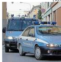
► Indagini della polizia