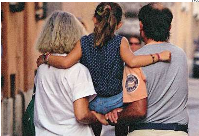
► Famiglia riunita

È IL 14 MARZO quando la preside dell'istituto inoltra al Comune di Basiglio una segnalazione urgente, in base alla denuncia di una maestra, in cui indica una sua alunna di 9 anni quale autrice di una vignetta particolare che la ritrae con il fratello. La famiglia viene informata, ma quasi da subito viene fuori la verità e cioè il disegno, inizialmente attribuito alla bambina, è in realtà stato disegnato da un'altra piccola. Insomma l'equivoco sembra chiarito o quasi. «Due giorni dopo la mamma di un'altra alunna si era presentata e aveva detto: quel disegno l'ha fatto mia figlia», spiega il