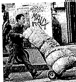
► Chinatown, slitta la Ztl

via e consentono agli occhi elettronici di rilevare le targhe delle auto. Gli uffici comunali sono al lavoro per preparare i pass per i residenti. In parte, è la produzione di questi documenti ad aver ritardato la partenza della Ztl. Ma ci sarebbe anche un altro ostacolo. Il Comune aveva deciso di realizzare in via Sarpi un'isola in cinque zone: ogni residente avrebbe avuto accesso soltanto alla porzione di strada in cui vive. Il ministero dei Trasporti, invece, ha chiesto di istituire unica zona a traffico limitato. Il risultato è lo stesso: l'iter per la zona a traffico limitato prima e per l'isola pedonale poi, slitterà. Mentre i residenti aspettano e protestano per il caos di furgoni e auto che durante la settimana (domenica compresa) continuano a sostare sulla via. ■