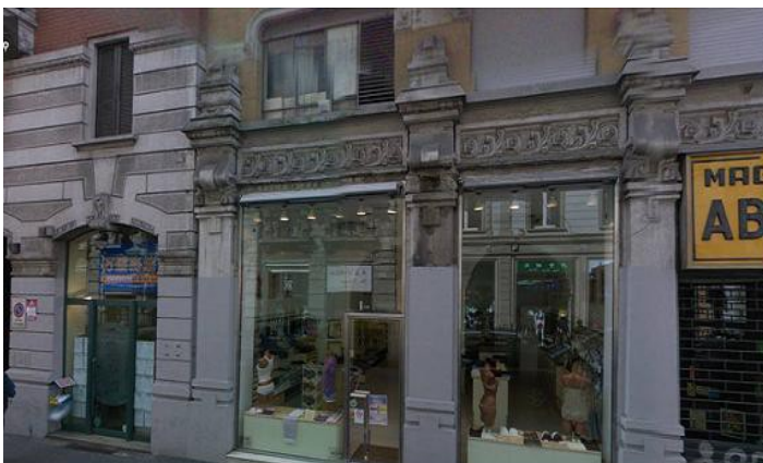
fino a settembre 2013