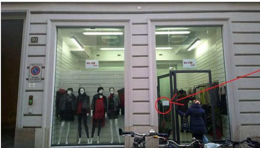
via Sarpi 10

Allegate foto degli esercizi commerciali oggetto degli esposti