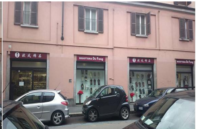
via Nicolini 25/a