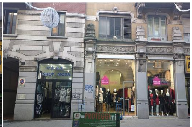
via Sarpi 3