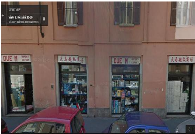
prima del primo-novembre