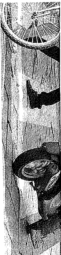
Il blocco Il divieto al traffico in via Brera e via Fiori Oscuri scatterà nel 2010

Da una parte, dunque, i commercianti che invocavano la nascita di una vero boulevard completamente chiuso alle macchine, dall'altra le esigenze di chi