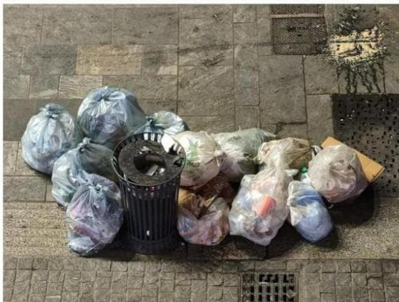
via Sarpi 5 gennaio 2026