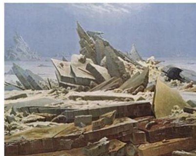
CASPAR DAVID FRIEDRICH - 1824